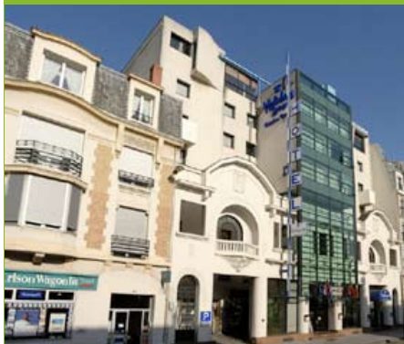
Hôtel Holiday Inn de Reims

Ce média télévisé s'adresse à tous ceux qui souhaitent fidéliser leur clientèle en leur offrant un service de qualité. J'invite bien sûr chaque établissement à opter pour cette nouvelle manière de communiquer afin de mieux faire connaître la région aux visiteurs et les inciter à y revenir.